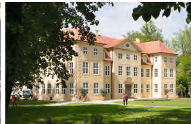
Schlosspark Mirow. Beim Spaziergang rund um das Schloss und auf der Liebesinsel kommen Romantiker ins Schwärmen.