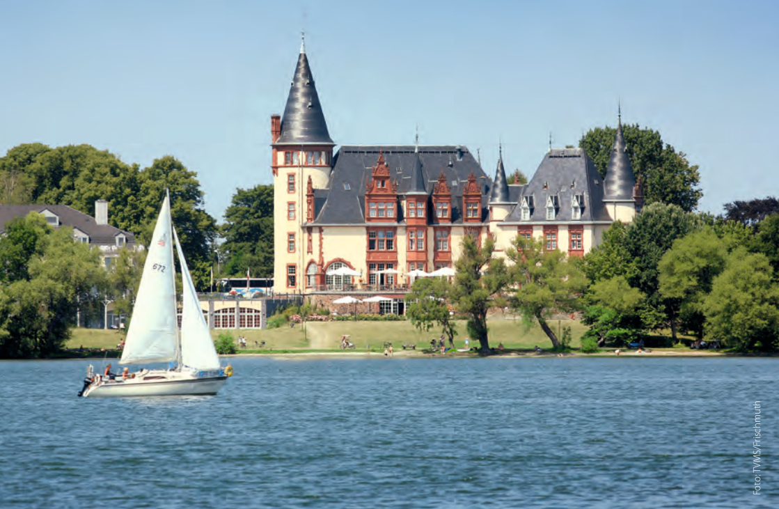
Schloss Klink. Das Schlosshotel an der Müritz verzaubert mit unglaublichem Seeblick.

Eingebettet in die sanfte Hügellandschaft des Naturparks Mecklenburgische Schweiz liegt das Schloss Teschow in einem 120 Hektar großen Anwesen. Der großzügige Park mit seinen mächtigen Bäumen grenzt direkt an den Teterower See. Für den großen Abschlag sorgt im Landhotel Schloss Teschow eine 27-Loch-Golfanlage, für Wohlbefinden der Erholungsbereich des Hauses. Mit einem üppigen Landschaftspark punktet auch das Schlosshotel Groß Plasten am Klein Plastener See. Der barocke Herrnsitz begeistert mit einem Kaminzimmer und einem Barocksaal in der Originalausstattung von 1751 sowie einer weitläufigen Seeterrasse. Nah am Wasser gebaut ist ebenfalls das Schloss Fleesensee . Inmitten der Mecklenburgischen Seenplatte verwöhnt das neobarocke Herrenhaus seine Gäste mit einem großen Landschaftspark, eleganten Hotelzimmern, einem prächtigen Spa-Bereich und einem 18-Loch-Golfplatz.