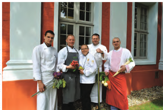
Gutsküchenwochen. Im Herbst zaubern die Küchenchefs herrschaftliche Menüs aus regionalen Zutaten.