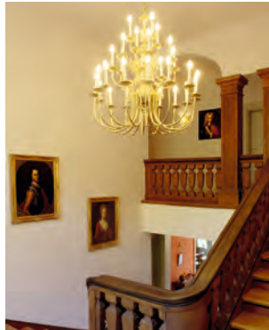
Schloss Kölzow. Die Nachkommen der Gutsgründer bewirtschaften das Herrenhaus heute als stilvolle Pension.

Fotos: TM/LeGrand - Landhaus Schloss Kölzow