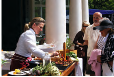
Schweriner GourmetGarten. Großes Schlemmen mit Aussicht über den Schweriner See.