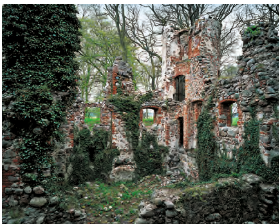
Festung Landskron. Im 19. Jahrhundert war die Veste ein beliebter Wallfahrtsort des Ruinentourismus. Auch heute lässt es sich im Windschatten mittelalterlicher Burgenromantik herrlich picknicken.