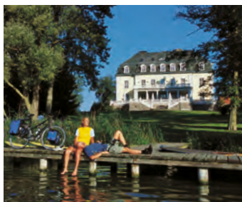
Kirche Ludorf. Der Kreuzritter Wipert von Morin brachte die Idee für diesen ungewöhnlichen Kirchenbau aus dem Heiligen Land mit. | Schloss Groß Plasten. Zur Ausstattung gehört auch ein hauseigener See.