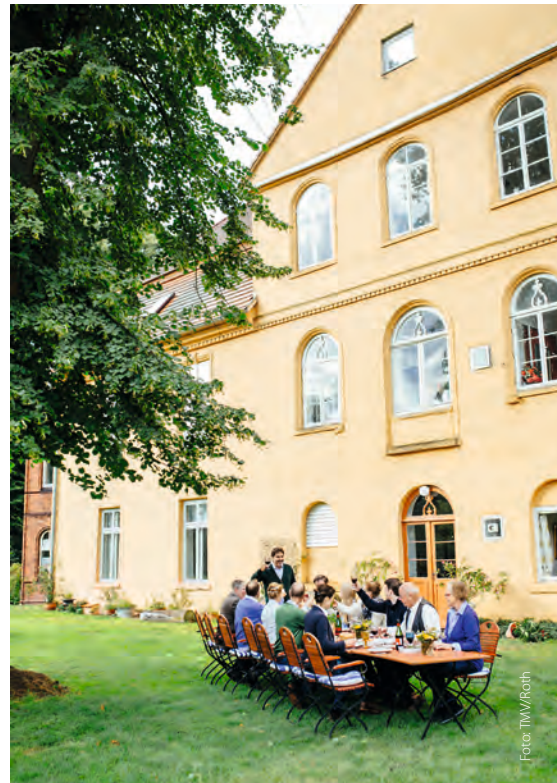
Schloss Lühburg. Die Hausherren des barocken Herrenhauses veranstalten regelmäßig »Zu Tisch bei Freunden«.

Zu Tisch bei Freunden. Im Mecklenburger ParkLand versüßen viele Gäste ihren Urlaub mit regionalen Köstlichkeiten und manchmal sogar mit einem Kocherlebnis in einer Gutsküche wie hier im Wildkräuterhotel Ehmkenhof.