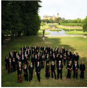
Mecklenburgisches Staatstheater Schwerin. Die großherzogliche Ausstattung mit reichlich Gold und Samt ist einmalig in Norddeutschland. MeckProms. Im Sommer lädt die Mecklenburgische Staatskapelle ihr Publikum zum Picknick in einige der schönsten Gärten ein.