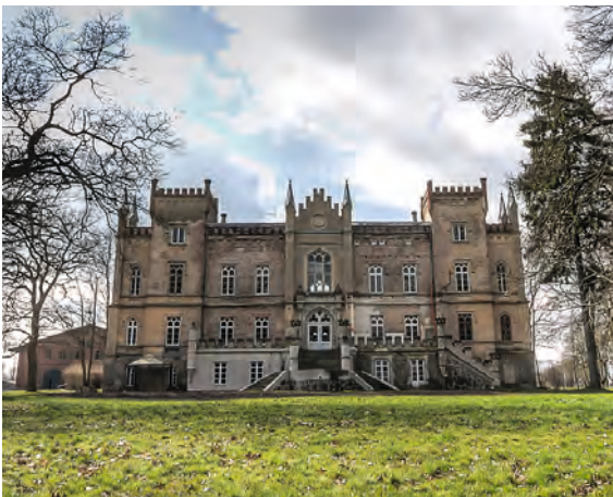
Herrenhaus Vogelsang. Mit opulenten Festen arrangiert der Hausherr die adlige Tradition des Hauses auf stimmungsvolle Weise neu.