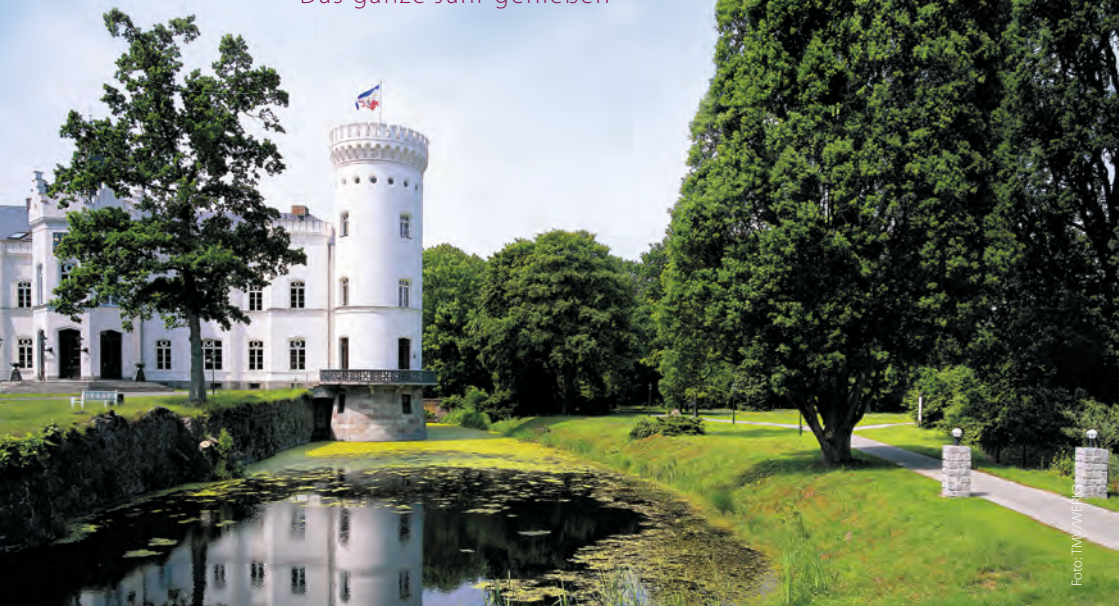
Schloss Schlemmin. Bei zahlreichen kulinarischen Events genießen Gäste das ritterliche Schloss und leckere Spezialitäten.