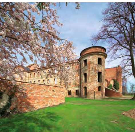
Schlossanlage Dargun. Den Grundstein legten dänische Mönche bereits im Jahr 1172.