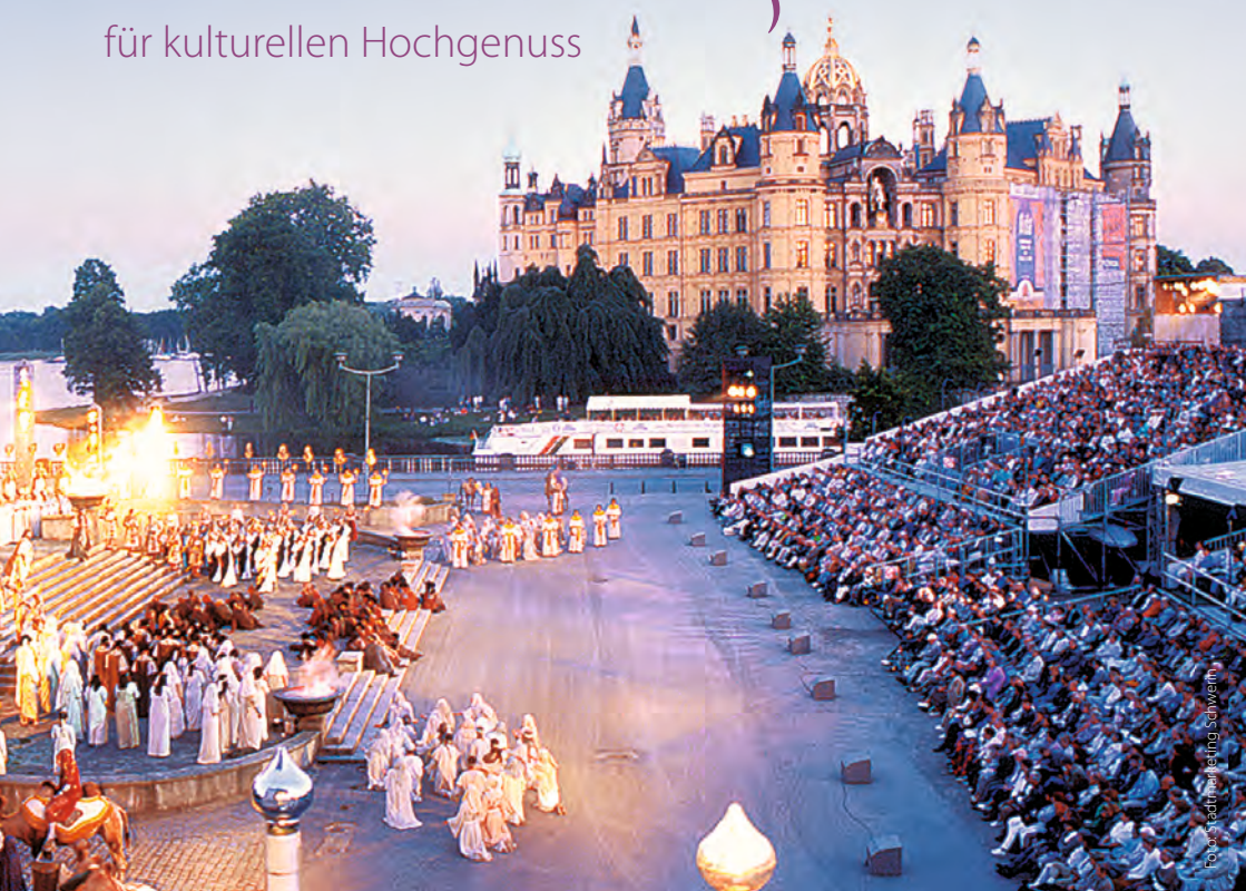
Schlossfestspiele Schwerin. Der kulturelle Höhepunkt des Sommers.

Gäste in Atem. Auf dem Programm stehen Opern von »La Traviata« bis »Aida«.